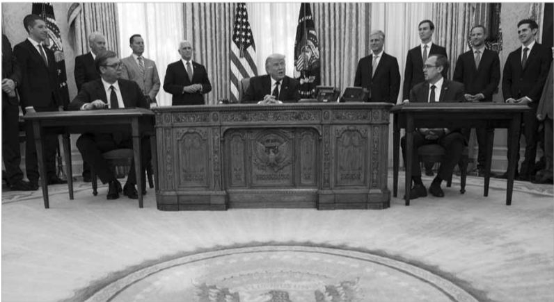
الرئيس الاميريكي دونالد ترامب -في الوسط- يشارك خلال مراسم توقيع اتفاقات مع الرئيس الصربي الكسندر فوتيتش -الى اليسار- ورئيس الوزراء الكوسوفاري عبدالله هوتي في البيت الأبيض الجمعة.

أعرب الاتحاد الأوروبي عن "قلقه الشديد" و"أسفه" في شأن تعهد بلغراد نقل سفارتها في إسرائيل من تل أبيب إلى القدس، مما يلقي بظلاله على معاهدة المحادثات بين صربيا وكوسوفو في بروكسيل.