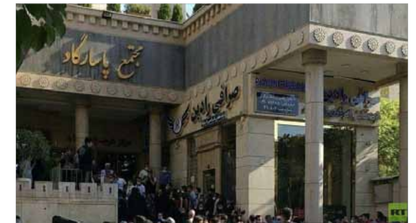
مواطنون يتجمعون أمام مكتب صرافة في طهران.

قال رئيس منظمة الطاقة الذرية الإيرانية علي أكبر صالحى أمس، إن الجمهورية الإسلامية بدأت تشييد وحدة في "قلب الجبال" قرب منشأة نطنز النووية لإنتاج أجهزة طرد مركزي متطورة. والهدف من تشييد الوحدة هذه أن تحل محل أخرى داخل نطنز دمرها حريق في تموز. وقالت إيران وقتئذ إن الحريق نتج عن تخريب وتسبب في أضرار جسيمة يمكن أن تبطل إنتاج أجهزة الطرد المركزي المتطورة المستخدمة في تخصيب الأورانيوم. ونقل التلفزيون الرسمي عن صالحى: "تقرر إنشاء وحدة أحدث وأوسع وأشمل بكافة المقاييس في قلب الجبال بالقرب من نطنز. لقد بدأ العمل".