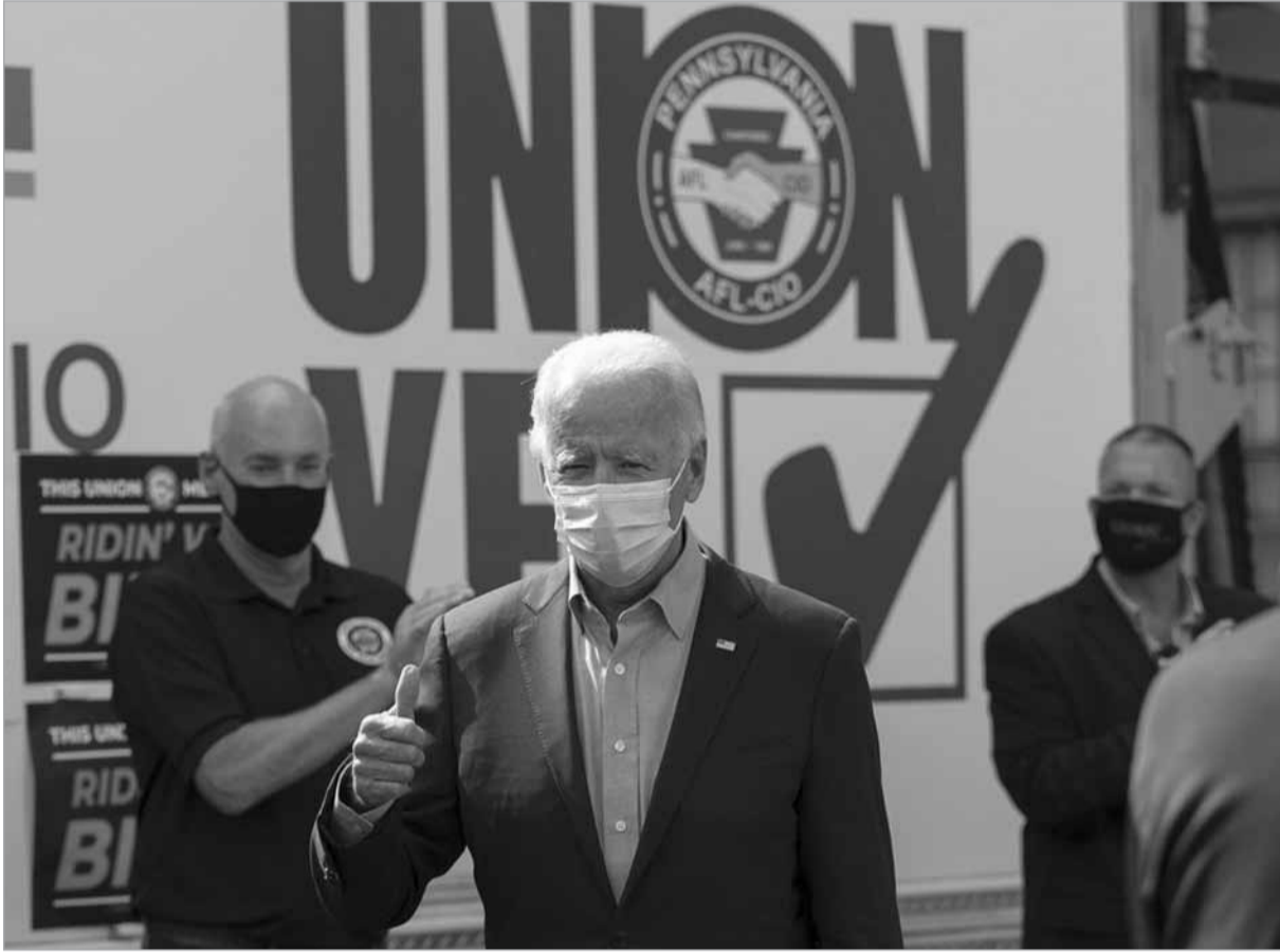
المرشح الديموقراطي للرئاسة الاميركية جو بايدن أمام مقر الاتحاد الاميريكي للعمل في مدينة هاريسبورغ بولاية بنسلفانيا الإثني.

بثبات على ترامب الذي، على غرار منافسه، يركّز بشكل متزايد على ولايات الغرب الأوسط الأساسية، مثل ويسكونسن التي يتوقع أن تشهد سباقاً محموماً. والإثنين، توجهت هاريس التي اختارها بايدن شريكة له في السباق الرئاسي إلى ويسكونسن حيث حذت حذو المرشح الرئاسي الديموقراطي، إذ التقت عائلة جايكوب بليك، الأميركي المتحدر من أصول إفريقية والذي أثار إصابته الشهر الماضي برصاص الشرطة موجة احتجاجات عارمة وأعمال شغب.