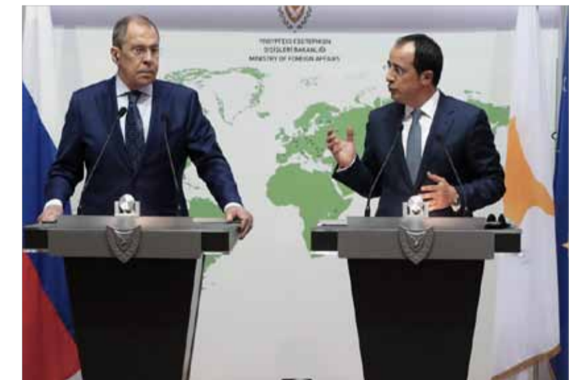
وزير الخارجية الروسي سيرغي لافروف الى اليسار- ونظيره اليوناني نيكوس كريستوفوليديس في نيقوسيا أمس.

قال وزير الخارجية الروسي سيرغي لافروف أمس خلال زيارة لقبرص، إن موسكو مستعدة للمساعدة في تخفيف التوتر في شرق البحر المتوسط، حيث تخوض قبرص واليونان مواجهة مع تركيا في شأن الحقوق البحرية والطاقة. وأضاف أن "روسيا تعتبر أن أي تصعيد آخر في المنطقة غير مقبول وتدعو جميع الأطراف إلى تسوية كل النزاعات عبر الحوار حصرا وعلى أساس القانون الدولي". ومضى قائلاً: "نحن مستعدون لتقديم المساعدة لإقامة هذا الحوار إذا طلب الطرفان ذلك". ويتصاعد التوتر في شأن نشاطات التنقيب البحرية، التي تقوم بها تركيا والتي تقول قبرص وحليفاتها اليونان إنها تنتهك سيادتهما. وقد أجرت تركيا واليونان وقبرص وفرنسا وإيطاليا تدريبات عسكرية أخيرا،