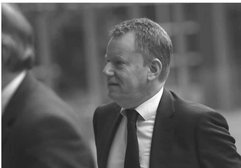
صورة مؤرخة في 16 تشرين الاول 2019 لكبير المفاوضين البريطانيين دول بريكست ديفيد فروست لدى وصوله إلى مقر الاتحاد الأوروبي في بروكسيل.

أوردت صحيفة "الفايننشال تايمس"، أن الحكومة البريطانية ستقدم اليوم مشروع قانون "من شأنه أن يلغي" النطاق القانوني لبعض أجزاء الاتفاق الذي حدد الخروج من الاتحاد الأوروبي في 31 كانون الثاني، بما في ذلك القواعد الجمركية في إيرلندا الشمالية.