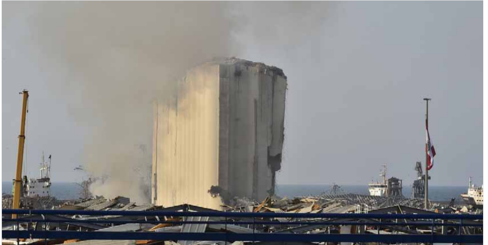
دخان حريق في المرفأ أفاد الدفاع المدني "النهار" أنّ سببه ردم بقايا ومخلفات الانفجار وادراقها بعلم الجيش الذي طلب المساعدة من الدفاع المدني لاتخاذ الاحتياطات اللازمة. (دسام شبازو)

فيما العد العكسي لنهاية مهلة التزام الولادة السريعة للحكومة الجديدة يقترب من لحظاته الحرجة، شكل الاجتماع التشاوري الثاني بين رئيس الجمهورية ميشال عون والرئيس المكلف مصطفى أديب امس منطلقا لاجتماع ثالث سيعقد هذا الأسبوع، ويفترض ان تعرض فيه مسودة تركيبة الحكومة بتوزيع الحقائق والاسماء ما لم تطرأ عقبات من شأنها عرقله الولادة الموعودة. والواقع ان المعطيات المتوافرة حيال مسار التأييف تشير الى ان حجم الحكومة التي يتمسك أديب بان تكون من 14 وزيرا وضع على طريق التسوية بينه وبين عون. ولكن المسألة الأساسية العالقة والأصعب تتمثل في مسألة المداورة التي تثير تباينات بين القوى التي ايدت تكليف أديب. وفي هذا السياق يرفض الثنائي الشيعي ان تنطبق المداورة على